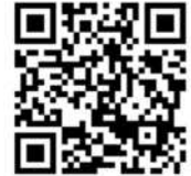
画像アップロード QRコード

11月16日（月）までに届かない場合はJNA事務局（03-3500-1580）までお問合せください。