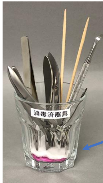
ガラス容器にセット